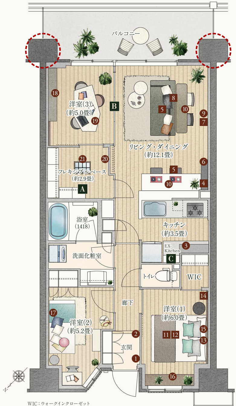
WIC：ウォークインクローゼット

キッチンの使いやすさを拡張する EX-Kitchenを採用。 予備の冷凍・冷蔵庫を置いたり、作業スペースや 見せる収納など多彩に利用できる空間を設けました。