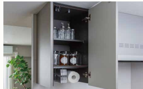
ストレージハンガー付吊戸棚(開き扉)