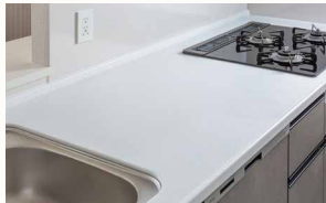
人工大理石キッチン天板