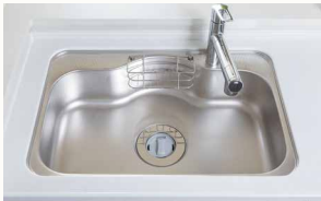
ZQシンク(低騒音仕様)