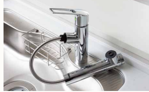
浄水器一体型シャワー水栓