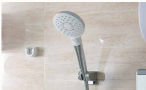
コンフォートウェーブクリックシャワー