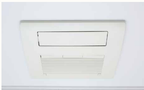
浴室換気暖房乾燥機