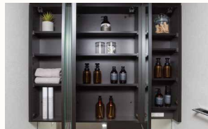
ミラーキャビネット