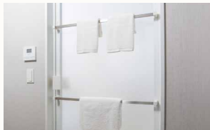
浴室ドアタオル掛け(2本)