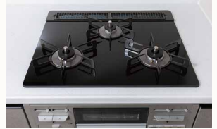
ガラストップコンロ