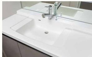
天板ボウル一体型カウンター